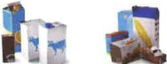
Briques alimentaires aplaties