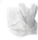
Mouchoirs et papiers absorbants souillés