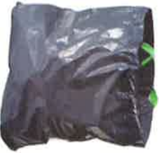
SAC OUVERT = OUI

PAS DE REGROUPEMENT AVEC CEUX DES VOISINS PAS D'ORDURES MENAGERES