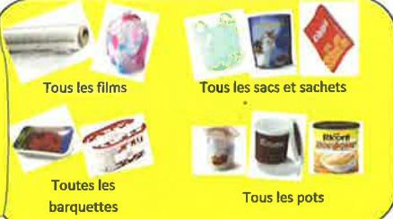
Tous les films