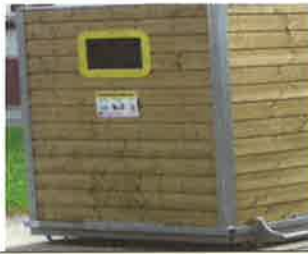
PLASTIQUES ACIER ALU