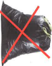
SAC FERME = NON

Pas de gravats, plâtre, carrelage, tuiles, vitrages, déchets électriques ou électroniques, peinture, produits chimiques, etc.