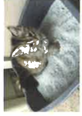
Litière non compostable (il existe de la litière compostable)

Tous les objets qui ne sont pas admis dans les bennes