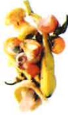
Epluchures et coquilles d'œufs

UNIQUEMENT DES SACS COMPOSTABLES TELS QUE CEUX DISTRIBUÉS GRATUITEMENT EN MAIRIE OU CEUX QUE VOUS POUVEZ RECUPERER AU RAYON FRUITS & LEGUMES DU SUPERMARCHÉ.