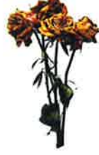
Bouquet de fleurs